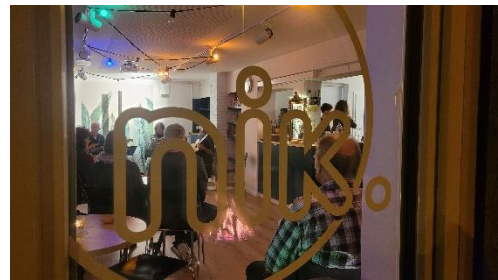
LIVE-MUSIK IM NIK.

In diesem Jahr wurden 29 Veranstaltungen im Quartiertreff nik. von Freiwilligen, der Betriebsgruppe und dem Quartierverein Niklausen organisiert und durchgeführt (Vorjahr 11):